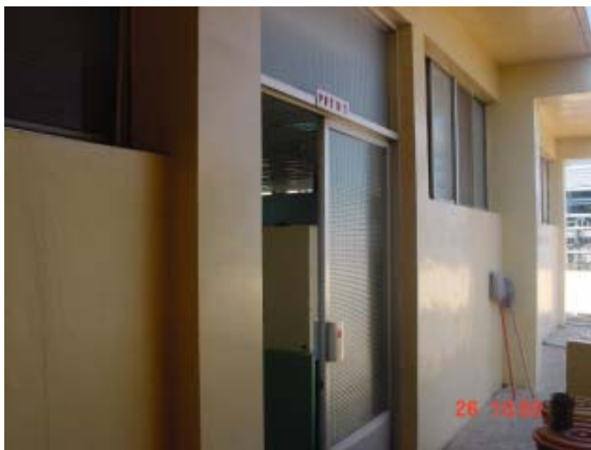
圖一、實驗室無標示毒化物運作廠之標示