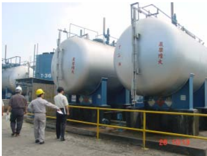
圖三、丁二烯及其他易燃液體儲放位置太近