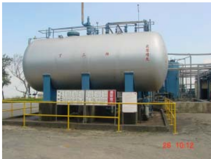
圖三、丁二烯標示不明